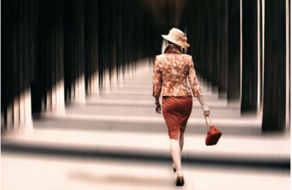
1. Platz im themenfreien Wettbewerb 2/2010: »Säulengang« von Carola Becker