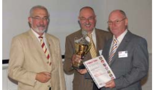
Unser Regierungspräsident und Schirmherr bei der Übergabe des Pokals für den erfolgreichsten Fotoclub

Die Ansprachen erfreulich kurz, die Siegerehrung per Beamer-Präsentation unterstützt und eine anschließende Beamershow der angenommenen und ausgezeichneten Werke, die den Besuchern sehr gut gefiel. Im Anschluss traf man sich bei einem Gläschen Wein, Kaffee und Kuchen im Foyer. Man diskutierte, traf viele Fotofreunde und verströmte gute Stimmung. Zum anschließenden Showblock der BSW Fotogruppe blieben noch