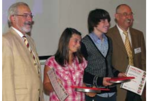
Die besten Jugendlichen