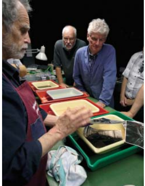
Bei der Positiventwicklung