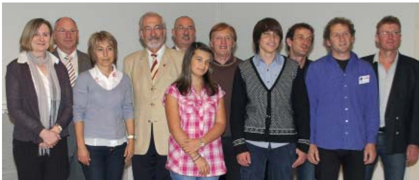
Die Preisträger der DVF-Bezirksfotoschau – Mainfränkisches Foto-festival – im Felix-Fechenbach-Haus in Würzburg