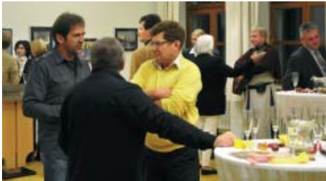
Gespräche während der Vernissage

Themen. Dabei sollen die Fotos mindestens 6 Monate hängen, spätestens aber nach 9 Monaten durch ein anderes Thema ersetzt werden. Begonnen wurde die Ausstellung mit Landschaftsbildern, die laut dem Festredner Herrn Erich Schwarz, der in Schwarzhofen ein großes Fotostudio betreibt,