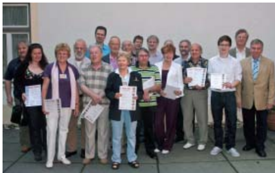
Die Preisträger der Bezirksfotoschau München/Oberbayern