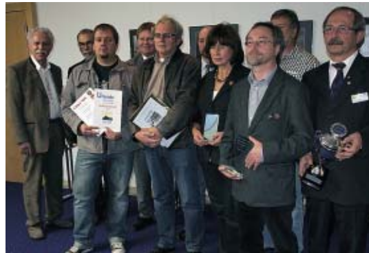
Die Sieger der Bezirksfotoschau in Amberg