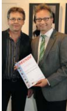
Auszeichnung für den Schwäbischen Fotoclubmeister