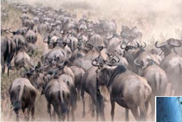
2. Platz freies Thema 3. Quartal 2010 »Gnuwanderung« Robert Büchner