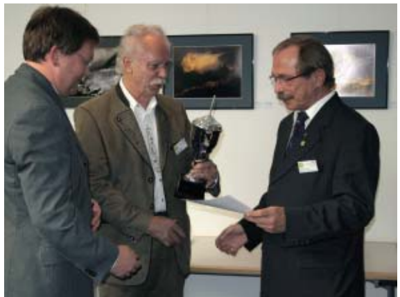
BEFO Clubwertung 1. Platz SGS-FOTO-AMBERG