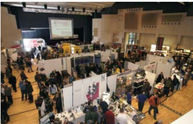
Ein Überblick über die Max-Reger-Halle während der 4. Fototage Weiden 2009. In diesem Rahmen präsentierten sich die Fotoclubs der DVF-Bezirke Oberpfalz/Niederbayern, Oberfranken und Mittelfranken.

www.dvf-ausschreibung.de wettbewerb xyungelöst.