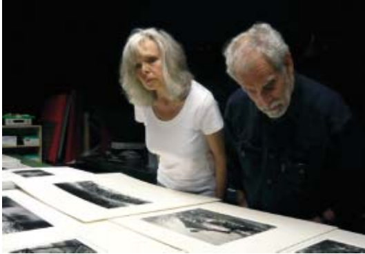
Bei der ersten Bildbetrachtung