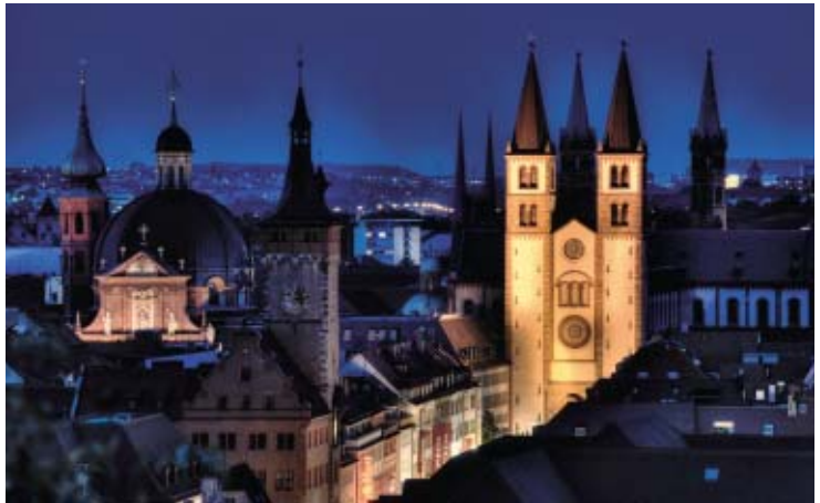
2. Platz Im Freistaat Bayern 3. Quart. »Kirchturmspitzen« Robert Issing