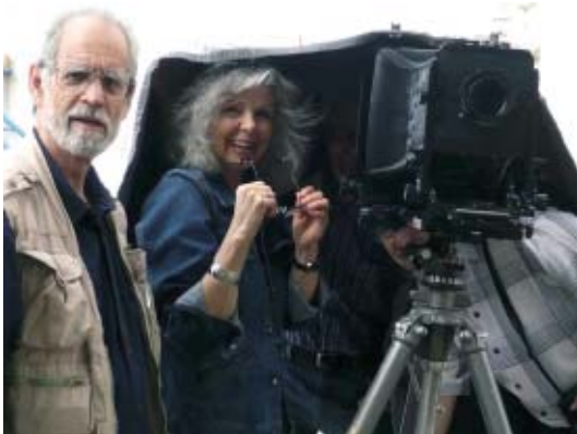
Bei der Visualisierung