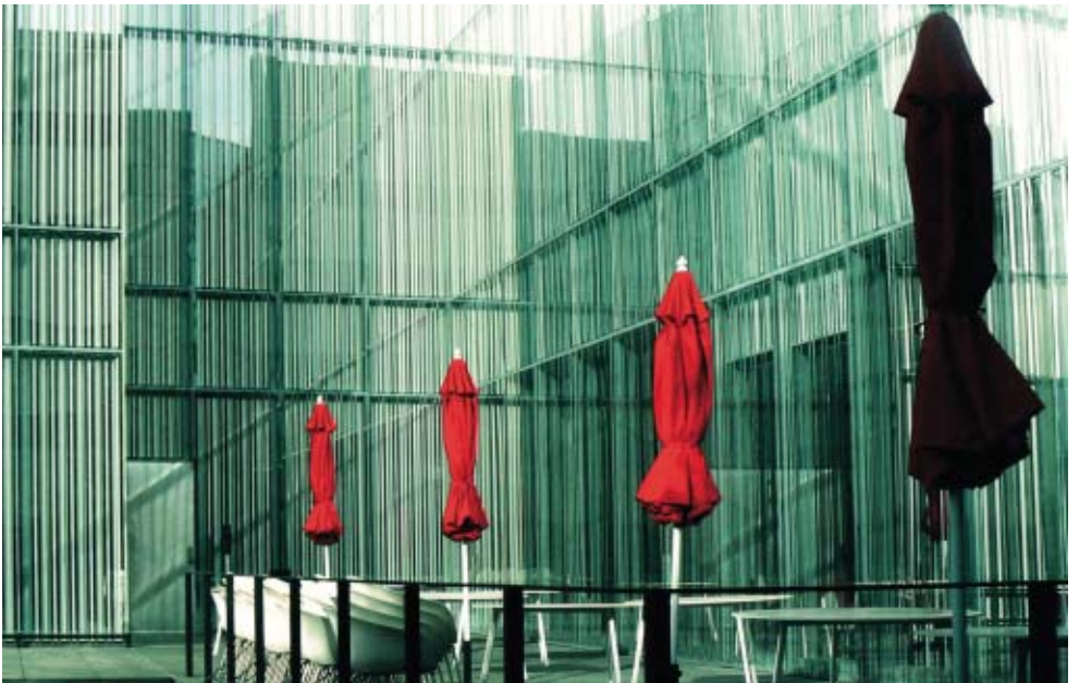
2. Platz im themenfreien Wettbewerb 2/2010: »roteSchirme« von Yvonne Göppel