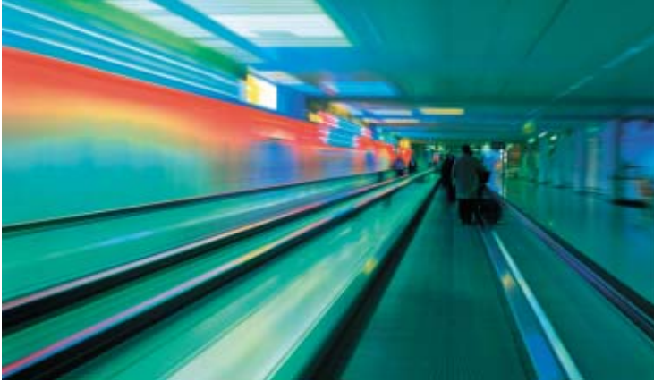
1. Platz Im Freistaat Bayern 3. Quart. »Traveller in Time« Stephan Fürnrohr