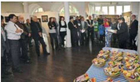
Interessierte Zuhörer bei der Eröffnung und Preisverteilung

In diesem Jahr haben die Fotofreunde Wiggensbach die Durchführung der Schwäbischen Fotomeisterschaft des DVF (Deutscher Verband für Fotografie) übernommen. Dazu wurden von 72 Autoren aus 8 Vereinen 402 Werke eingereicht. Das externe Jurorenteam mit Christine Motz (FotoGen München), Herbert Haas (Vorsitzender Fotoclub Schrobenhausen) und Wolfgang Rappenecker (Fotofreunde Blaustein) bewertete die Bilder und nahm 122 Fotos in die Wertung. Davon wur-