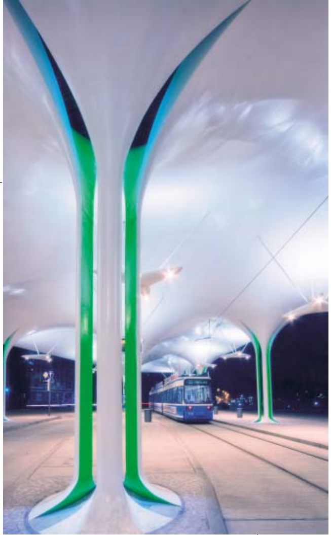
3. Platz Quartals-Themenwettbewerb Im Freistaat Bayern 2/2010: »Himmlische Straßenbahn« von Peter Hildebrand