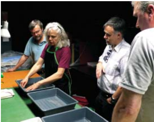
Bei der Negativentwicklung