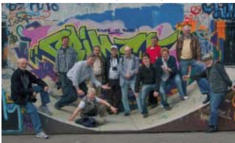
Die Fotofreunde vom Camera Club Markt Schwaben

Am 26. und 27. Juni wurde vom Camera Club Markt Schwaben die diesjährige BezirksFOTOschau durchgeführt. Zu der hervorragend organisierten Veranstaltung anlässlich des 35. jährigen Clubjubiläums wurden insgesamt 369 Werke von 10 DVF-Clubs und zwei Direktmitgliedern eingereicht.